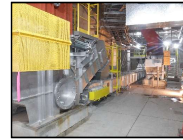
灰コンベヤ(焼却灰を運搬する装置)