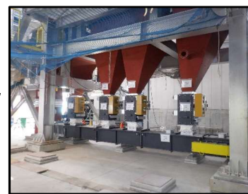
灰シュート(落ちる焼却灰をうける)

令和4年度は地上5階までの工事が予定通り進みました。また、プラント設備も工程通り機器搬入及び据付を完了しました。工事の進捗率は42.8% (建築67.0%、プラント15.5%)です。